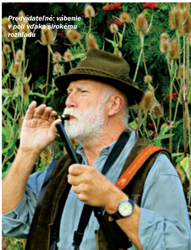
Predvídateľné: vábenie v poli vďaka širokému rozhľadu