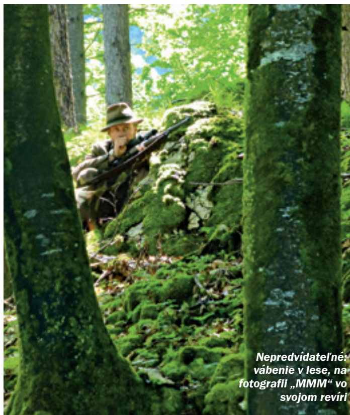
Nepredvídateľné: vábenie v lese, na fotografii „MMM“ vo svojom revíri